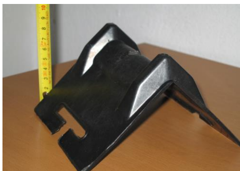
Kątownik czarny typu A Charakterystyka: średnio – twardy Rozmiar: 90 x 90 x 135mm Przeznaczenie: uniwersalne Szerokość na pas max 80 mm