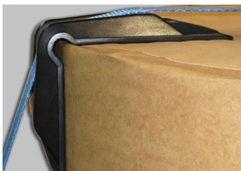
Kątownik czarny typ TTG 1 Charakterystyka: bardzo twardy Rozmiar: 185 x 145 x 150mm Przeznaczenie: kręgi papieru, folii, kartonu Szerokość na pas max 60 mm