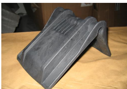
Kątownik czarny PTNT Charakterystyka: średnio – twardy Rozmiar: 170 x 130 x 145mm Przeznaczenie: uniwersalne Szerokość na pas max 60mm