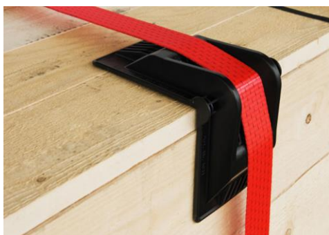
Kątownik czarny typ TTG 2 Charakterystyka: średnio – twardy Rozmiar: 185 x 145 x 150mm Przeznaczenie: uniwersalne Szerokość na pas max 60 mm